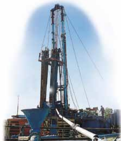
Réalisation du forage de Saint-Sauveur (33)