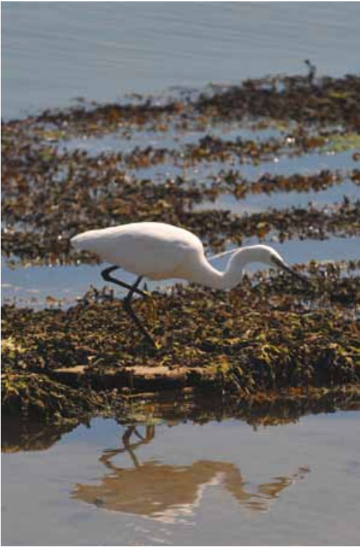
L'aigrette garzette fréquente les milieux aquatiques pour se nourrir.